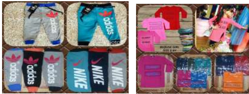
Caption : antara baju kanak-kanak yang dijual