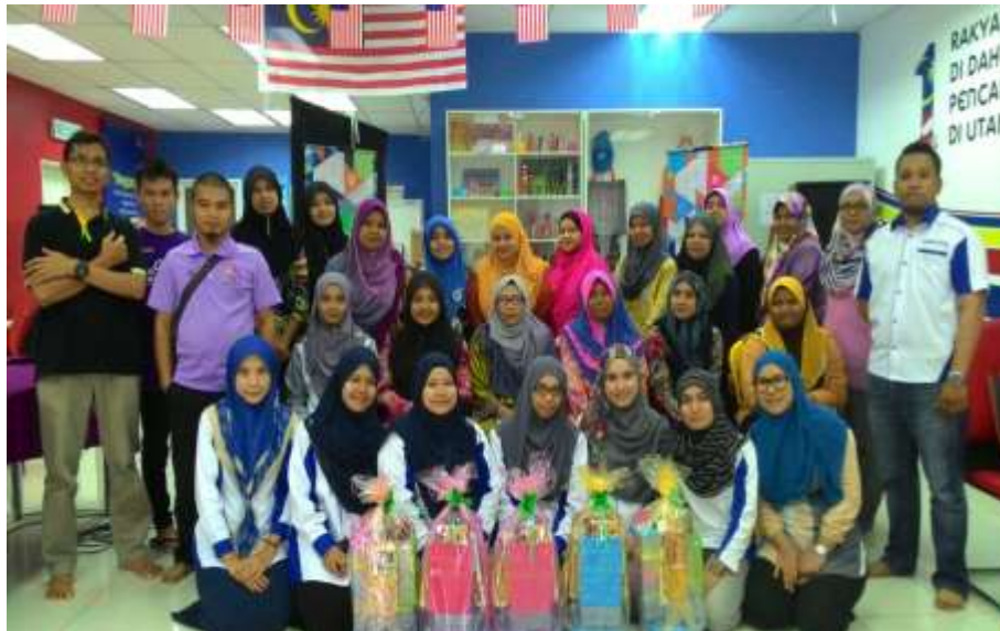
Caption : Bengkel Myshop di PI1M Taman Jaya Kemayan