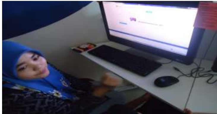
Kelas myshop dan keusahawanan