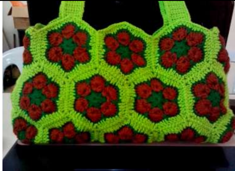
Caption : Antara jenis jahitan kait.