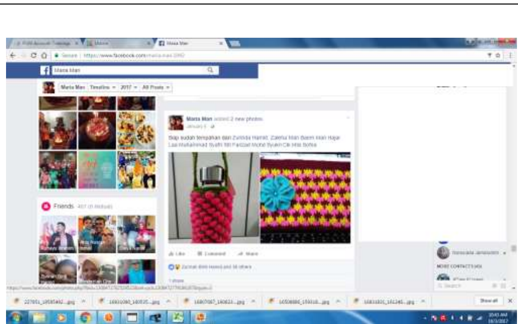
Caption : FB