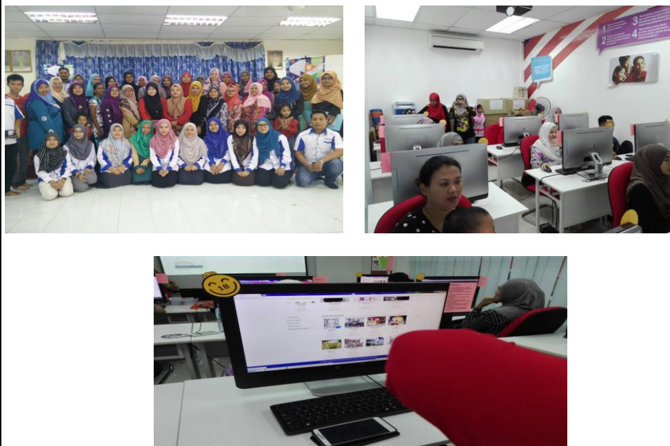
Caption : Bengkel usahwan myshop bersama AIM dan Hari Dashboard Komuniti(myshop)

iv) Lain-lain (contoh : proses penghasilan produk, penglibatan dalam aktiviti lain, dsb)