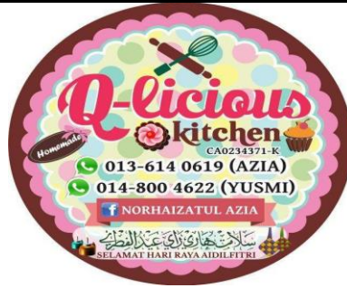
Caption : Laman FB dan promosi di FB untuk mempromosikan barang/produk dan testimoni

iv) Lain-lain (contoh : proses penghasilan produk, penglibatan dalam aktiviti lain, dsb)