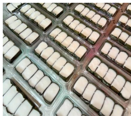
Caption : Jenis2 kek dan biskut untuk sebarang majlis.