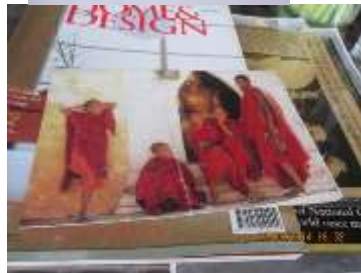
Gambar 6: Menunjukkan gambar lukisan yang ditempah oleh Chef Wan. Gambar ini kelihatan unik kerana jika dilihat dengan teliti semua individu didalam gambar ini hanya menunjukkan 1 kaki sahaja.