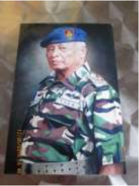
Gambar 4: Menunjukkan hasil lukisan potret terkini yang di tempah oleh Sultan Pahang.