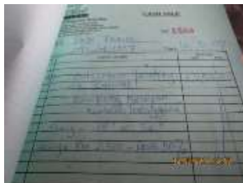
Gambar 9: Menunjukkan bukti jual beli kepada Dato' Farid.