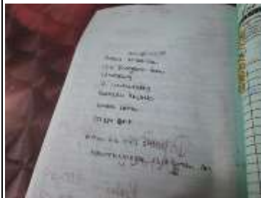
Gambar 8: Menunjukkan gambar bukti resit kepada pelancong daripada UK.