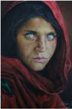
Gambar 2: Menunjukkan salah satu karya beliau bertajuk Afghan Girls yang cukup mendapat permintaan ramai.