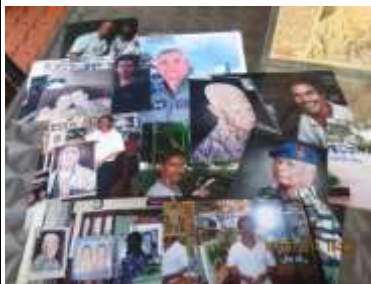
Gambar 14: Menunjukkan gambar lukisan dan koleksi daripada album En. Ismail Hussin.