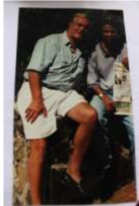
Gambar 13: Menunjukkan pelancong dari Belgium yang menunjukkan akhbar Belgium yang mempamerkan cerita mengenai lukisan En. Ismail.