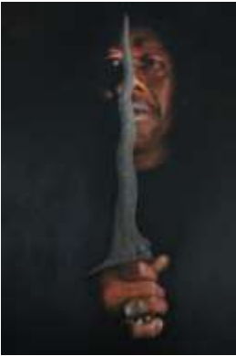
Gambar 3: Menunjukkan karya yang menjadi koleksi En.Ismail "untitled" oil paint on canvas