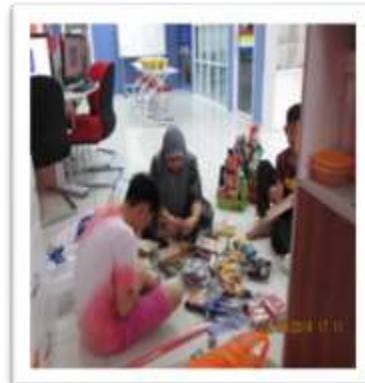
Tee membantu petugas PI1M dalam membungkus hadiah untuk Program Sehari Bersama Pi1M Bera.