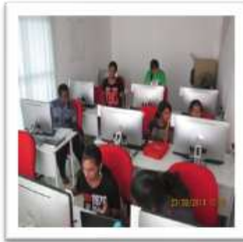
Tee membantu rakan-rakan yang lain