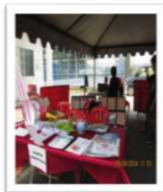
Tee Kok Ann turut serta dalam program Sehari Bersama PI1M Bera.