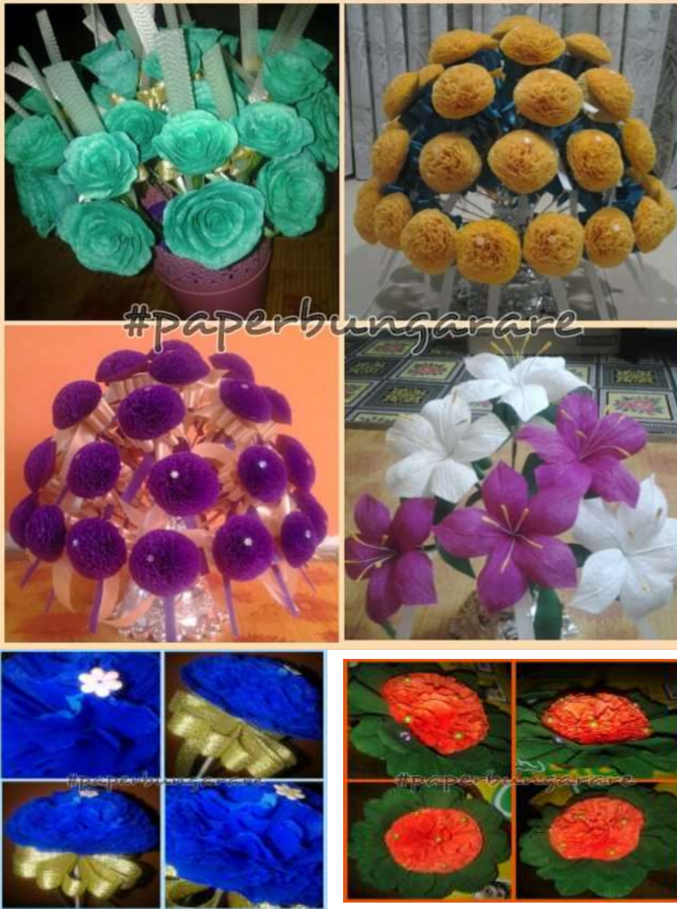
Caption : CONTOH DESIGN BUNGA